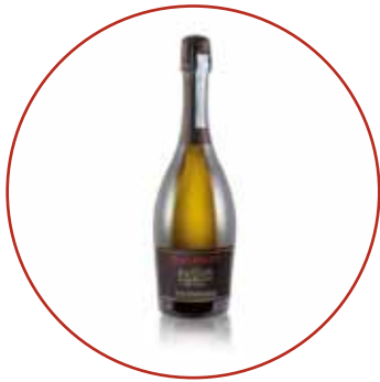
Prosecco Villa de Claricini € 7,50