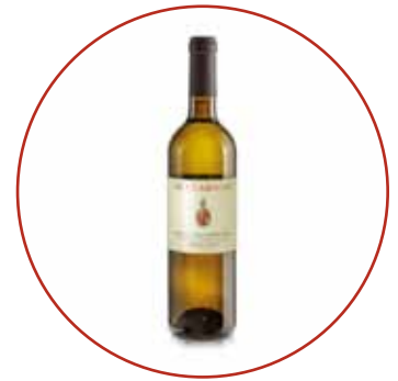
Friulano 2020 € 9,80