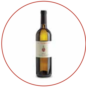
Pinot grigio 2020 € 9,80