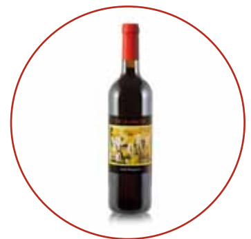
Rosso Tavagnacco 2019 € 14,50