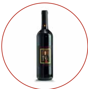
Refosco dal p.r. 2019 € 9,10