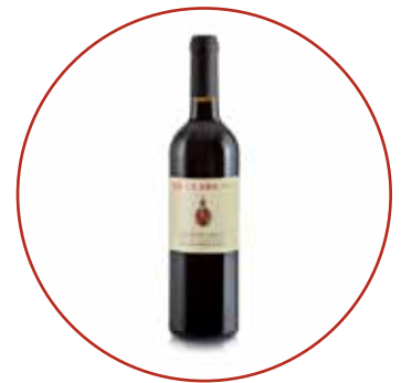
Schioppettino 2018 € 9,10